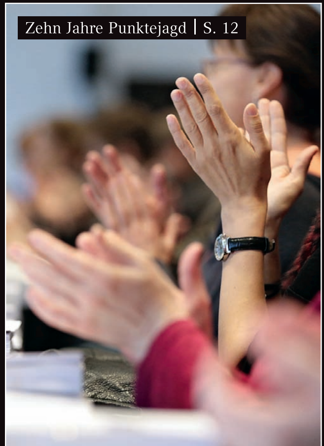
Zehn Jahre Punktejagd | S. 12